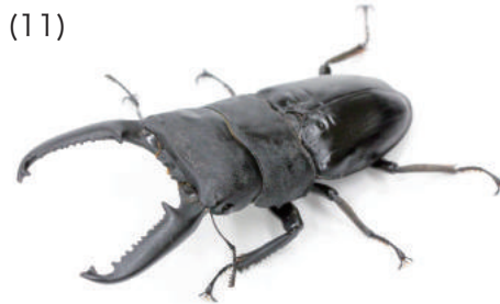
パラワンヒラタクワガタ