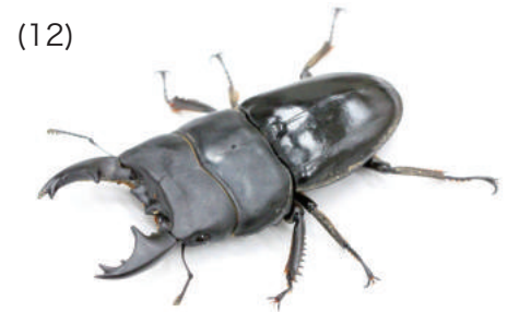
アルキデスヒラタクワガタ