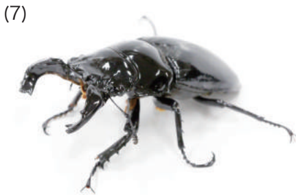
タランドゥスオオツヤクワガタ