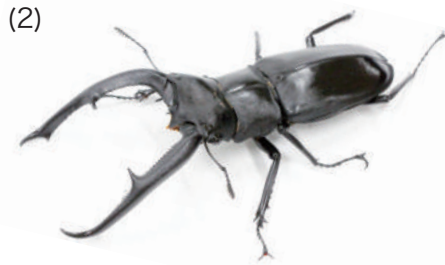
マンディブラリスフタマタクワガタ