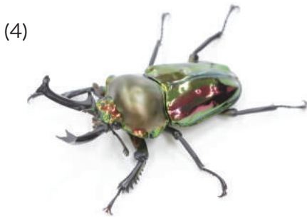
ニジイロクワガタ