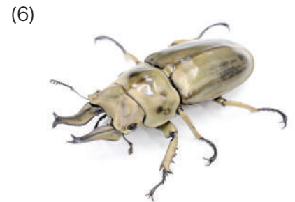
ローゼンベルグ オウゴンオニクワガタ