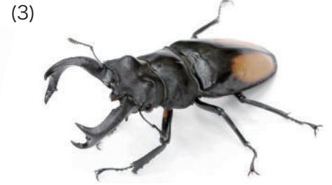
パーリーフタマタクワガタ (セアカフタマタクワガタ)