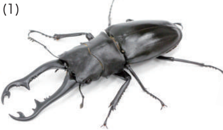
ギラファノコギリクワガタ