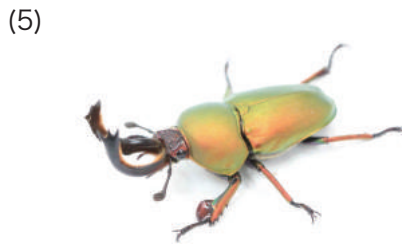
パプアキンイロクワガタ