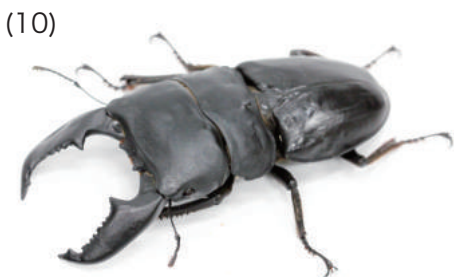
スマトラヒラタクワガタ