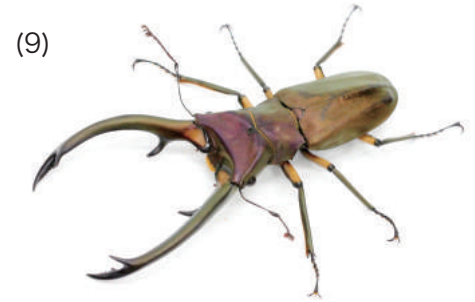
エラフスホソアカクワガタ